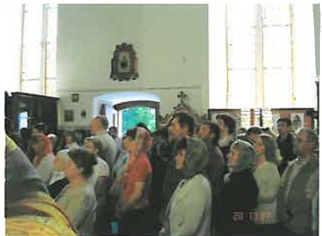
Многочисленные вѣрующіе прїѣхали изъ разныхъ городовъ