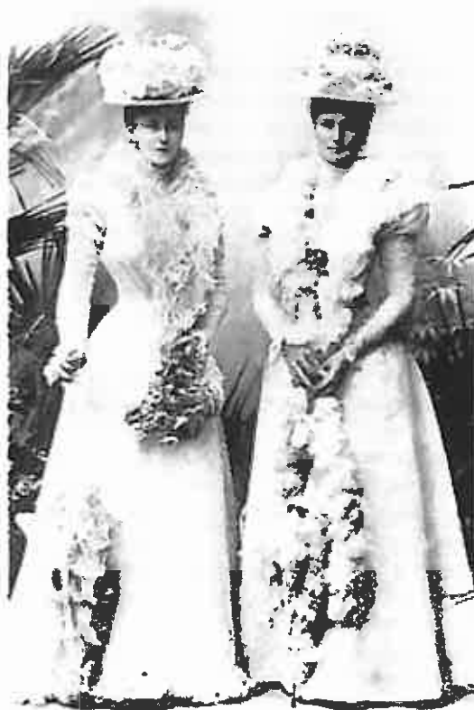
Е.И.В. Великая Княгиня Елизавета Ѳеодоровна и Императрица Александра Ѳеодоровна