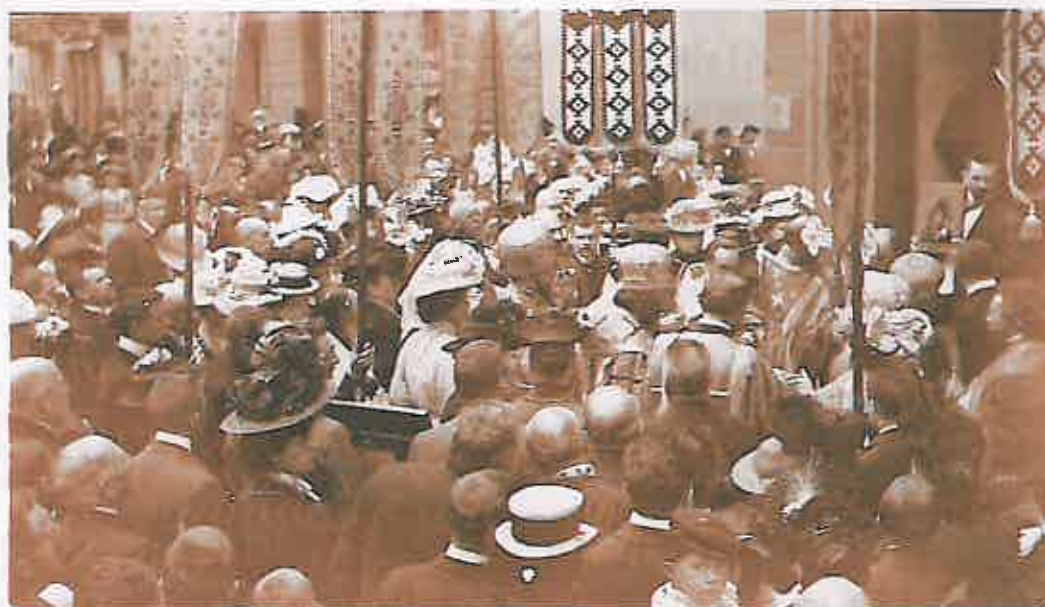
Крестный ходъ въ день освященія храма 8/21 іюля 1908 г.