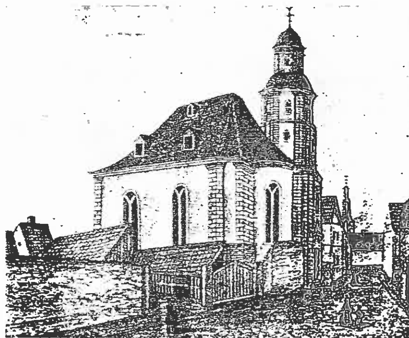
Рейнгардскирхе. Видъ съ сѣверо-запада (рисунокъ 1854 г.). Слѣва виденъ прицерковный домъ (съ трубой).