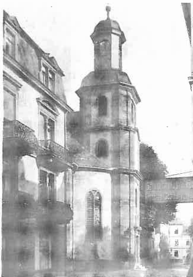
Русская церковь въ Бадъ-Наугеймѣ (снимокъ 1908 г.)