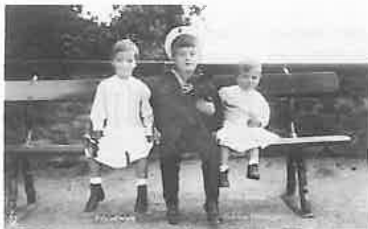
Цесаревичъ Алексѣй съ двоюродными братьями во Фридбергѣ

Прежній Строительный комитетъ былъ преобразованъ въ Попечительство (Fürsorge-Komitee), въ которомъ по уставу состояли бургомистръ и курдиректоръ, и которое взяло на себя круглогодное попеченіе о храмѣ, особенно внѣ лѣтняго сезона, когда въ городѣ почти не было русскихъ и богослуженія не совершались.