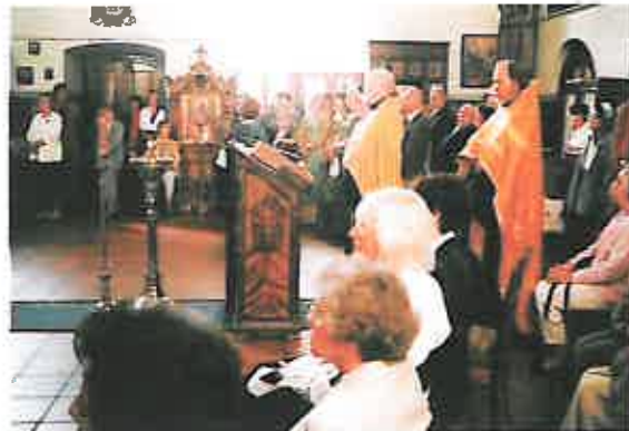
Молебенъ въ день 100-лѣтія освященія храма 8/21 іюля 2008 г.