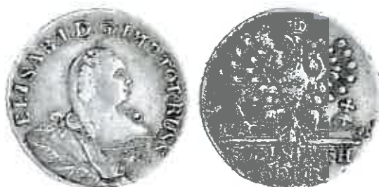
Монета Русской Пруссии с изображением Императрицы Елизаветы I (1761 г.)