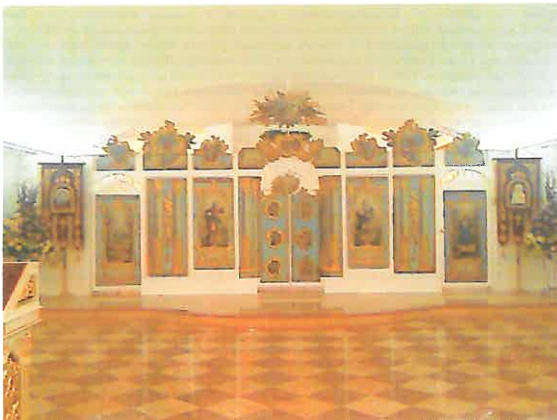
«Мемельскій» иконостасъ послѣ реставраціи въ нижнемъ храмѣ Нерукотворнаго Спаса въ Королевцѣ