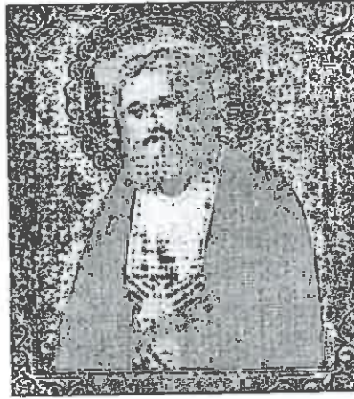
Der heilige Seraphim von Sarow.

Brigitta Gebauer bietet an jedem ersten Dienstag im Monat sowie nach Vereinbarung Führungen durch die Kirche an (Telefon 06032/5406).