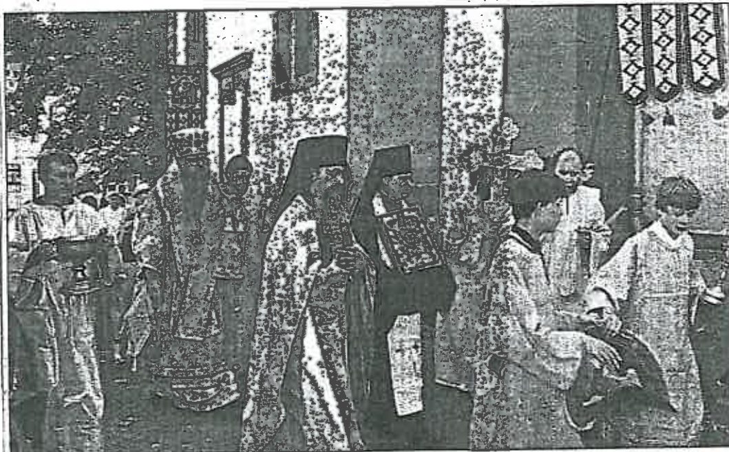
Würdenträger der russisch-orthodoxen Kirche in Deutschland bei der Prozession um die Reinhardskirche.

Agapit aus Stuttgart, unter den Teilnehmern waren zahlreiche Geistliche der russisch-orthodoxen Kirche aus ganz Deutschland und Bürgermeister Bernd Rohde. Die Gemeinde hatte die Reinhardskirche 1907 erworben. Ein Jahr später schenkte Erzbischof Innozenz die Ikonostase der alten Klosterkirche von Sarow den Glaubensbrüdern in Bad Nauheim. Im Kloster Sarow hatte der ehrwürdige Seraphim jahrelang gewirkt. Daraufhin ernannte man ihn zum Schutzpatron.