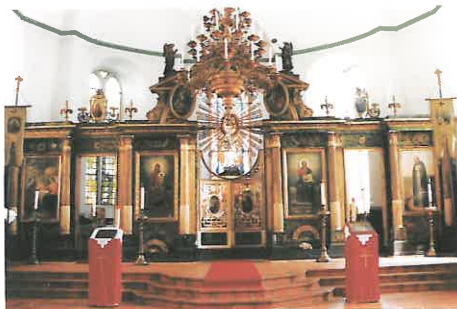
Саровскій иконостасъ въ братскомъ храмѣ свт. Иннокентія Иркутскаго и прп. Серафима Саровскаго въ Бадъ-Наугеймѣ, передъ которымъ нѣкогда молился самъ Преподобный.